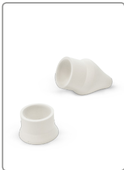
Dop en stopper

Rondom schoongesneden en aan de bovenzijde afgewerkt met een stevig dubbel gestikte zoom