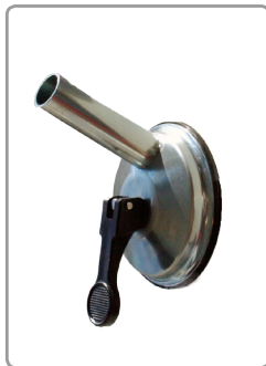
Zeer solide zuignap